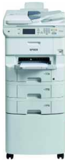
WORKFORCE PRO WF-6590 D2TWFC MFP INK-JET COLOR A4