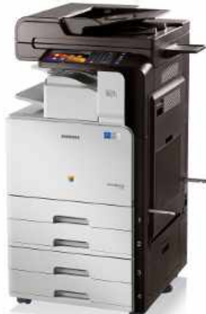
SAMSUNG CLX-9201 /9251/9301 MULTIFUNCIÓN LASER COLOR A3