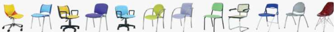
FAMA GIRATORIA 92 DYANA 94 DYANA GIRATORIA 96 FISSA 98 FISSA GIRATORIA 100 INCA 102 GUS 104 LACIO 106 VIENNA 108 CORDOBA 110 LEÓN 112 GLAMOUR 114