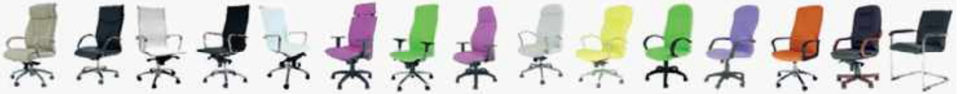
JARAMA 12 MAYU 14 JR MALLA 16 JR PIEL 18 JR NAPPEL 20 NEUS 22 AIRE 24 DUNCAN 26 DYLAN 28 JOHN 30 DUERO 32 EUROPA 34 ROCKY 36 GIARDINO 38 APOLO 40