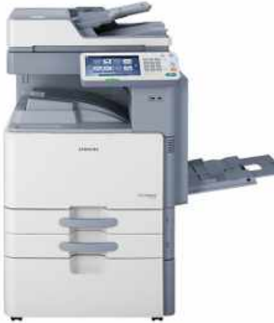
SAMSUNG SCX-8030/8040 MULTIFUNCIÓN LASER A3 B/N