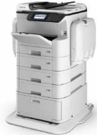
WORKFORCE PRO WF-C869R D3TWFC MFP INK-JET COLOR A3