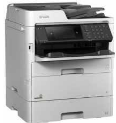
WORKFORCE PRO WF-C 579 RDTWF A4