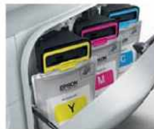
Unidades de consumibles de tinta CMY de WorkForce Pro RIPS

La nueva tecnología WorkForce Pro RIPS permite imprimir hasta 75.000 copias de calidad profesional con un único pack de consumibles de tinta 4 . Gracias a la impresión a doble cara y a la compatibilidad con las soluciones para flujos de trabajo Document Capture Pro e Email Print for Enterprise 7 , la gama WorkForce Pro RIPS cubre cualquier necesidad de impresión y gestión documental relacionada con los negocios.