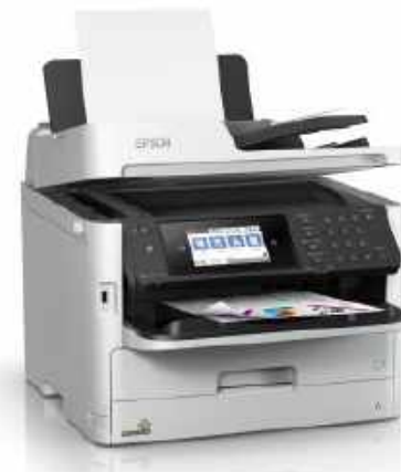
WORKFORCE PRO WF-C5790DWF A4