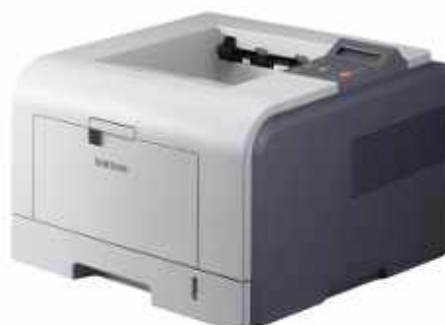
SAMSUNG ML-3471ND IMPRESORA LASER DIN-A4 B/N