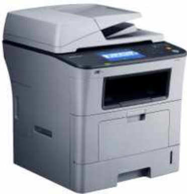
SAMSUNG SCX-5835FN MULTIFUNCIÓN LASER DIN-A4 B/N