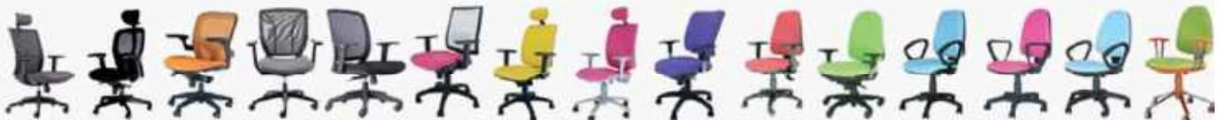
ARKO 44 BEA 46 AXEL 48 ORIÓN 50 LUNA 52 BRYAN 54 SIGNO 56 SIGNO SILVER 58 IRIS 60 EQUIS 62 KORAL 64 MEDICAL 66 SALDAÑA 68 IBIZA 70 POP 72